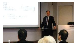
スライドで講座を進行し確認問題を行います