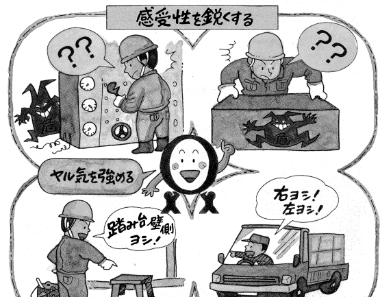
指差し呼称の効果検定実験結果(平成6年 財団法人総合技術研究所)